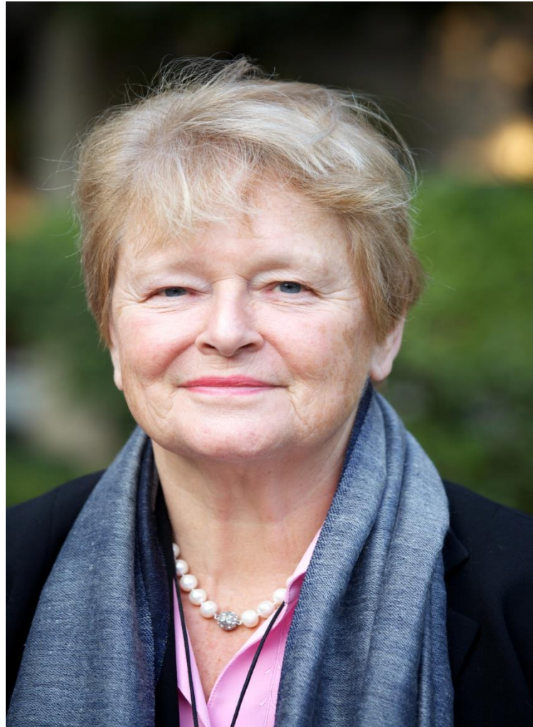
Gro Harlem Brundtland, Läkare, fd stadsminister i Norge, fd GD WHO